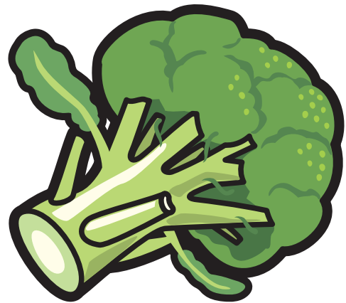
ぶろっこりい ブロッコリー