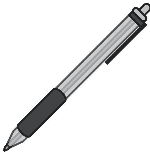
ぼ お る ペ ン ボールペン