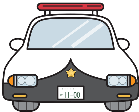
ぱとカー パトカー