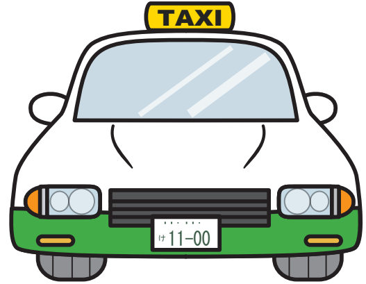
たくしー タクシー