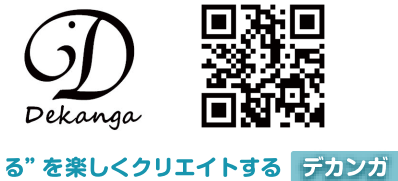
る”を楽しくクリエイトする デカンガ

や きとり、 やきとうもろこし。 おまつりでうって いるものをいう。 いえたら、 ます 1マス すすむ。