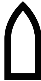
た りよかくせん その他の旅客船