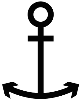
ちほうこう 地方港