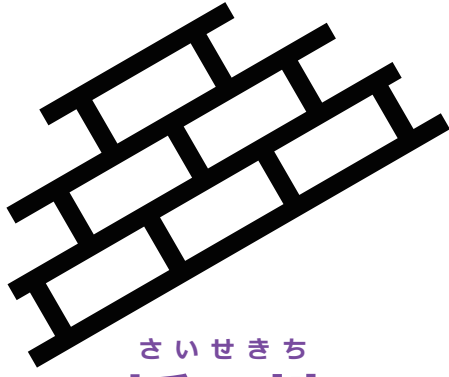
さいせきち 採石地