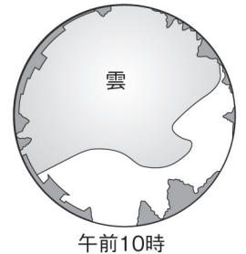
■ 雲量計測器で観測した雲の様子