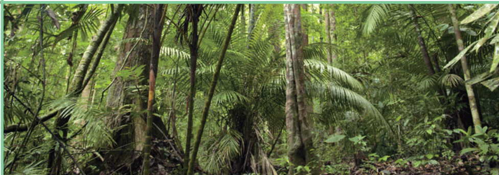
ボルネオ島の熱帯雨林 (マレーシア)