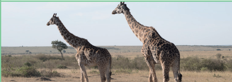
サバナのキリン (ケニア)