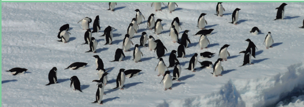
氷原のペンギン(南極)