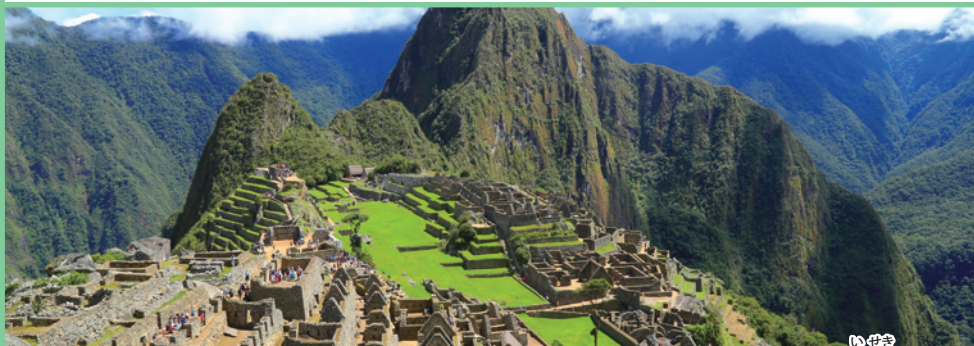
マチュピチュ遺跡(ペルー)