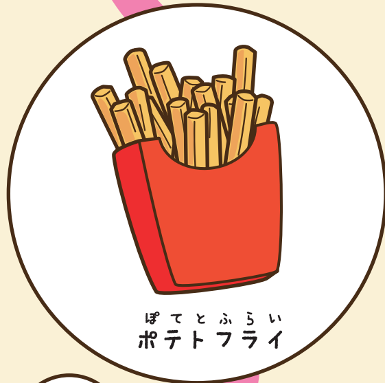
ぽてとふらい ポテトフライ