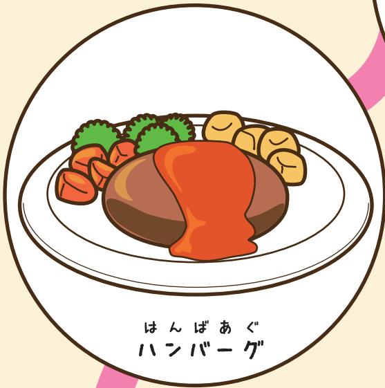
はんばあぐ ハンバーグ