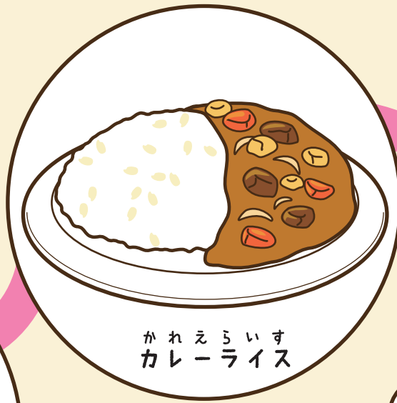
かれえらいす カレーライス