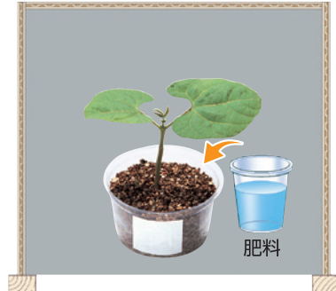
おおいをする。 肥料をあたえる。

(1) ア～ウで成長のようすを比べると、水はどうしますか。正しいものに○をつけましょう。