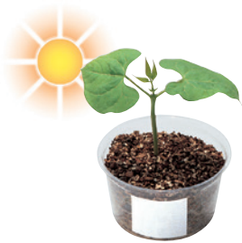
日光に当てる。 肥料はあたえない。