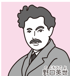
のぐちひでよ 野口英世