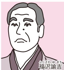
ふくざわゆきち 福沢諭吉