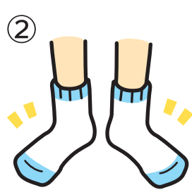
② くつを はくまえに はだしの あしに はくものだよ