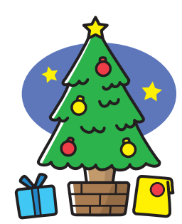
12がつ25にち いえず きりすと イエス・キリストの たんじょうびだよ