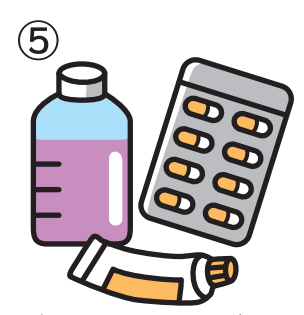
⑤ びょうきや けがを なおすために のんだり むったり するよ