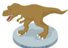
ティラノサウルス