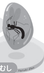
こはくの中のむし