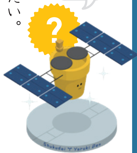
うちゅうたんさき